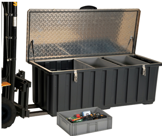
Weitere graue Transportboxen zusätzlich bestellbar